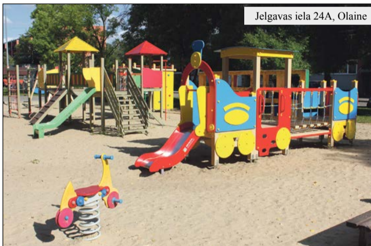
Jelgavas iela 24A, Olaine

Olaines novada pašvaldība regulāri atjauno esošās rotaļu un sporta iekārtas, kā arī papildina tās ar jauniem elementiem vai izveido jaunus rotaļu un sporta laukumus. Pašvaldība īpašu vērību pievērš rotaļlaukumam jaunatnājumam, jo apzinās to nozīmi bērnu attīstībā un harmoniskas personības veidošanā. Rotaļlaukumā bērns attīstās gan fiziski, gan garīgi, viņš apgūst sociālās prasmes, pavada laiku sveigā gaisā kopā ar ģimeni vai draugiem. Tādējādi tiek mazināti bērnu vidū izplatītie negatīvie ieradumi un to ietekme, viņi mazāk laika pavada pie televizora un datora. Olaines novadā dzīvo 1396 bērni vecumā no 0 līdz 6