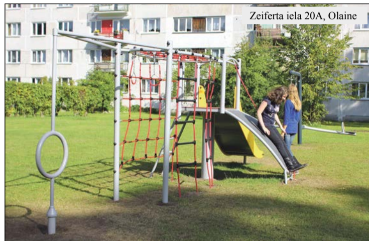
Zeiferta iela 20A, Olaine