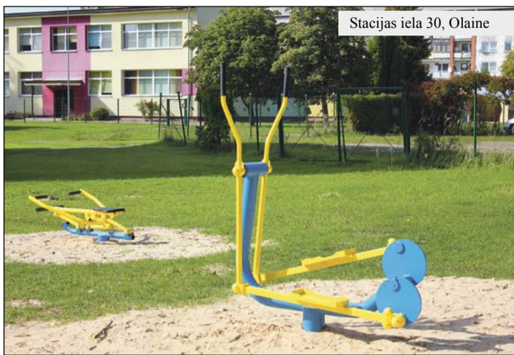
Stacijas iela 30, Olaine