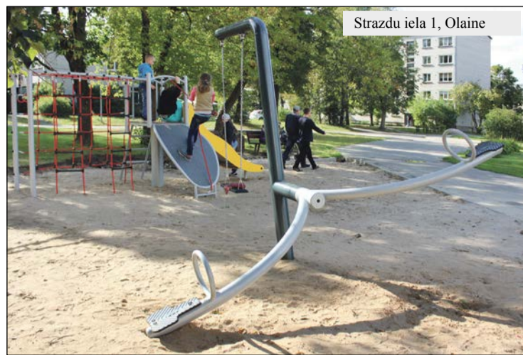
Strazdu iela 1, Olaine